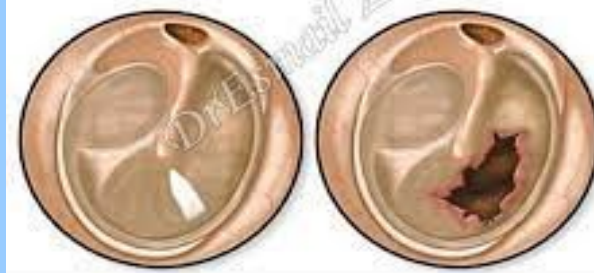
پرده گوش پاره شده